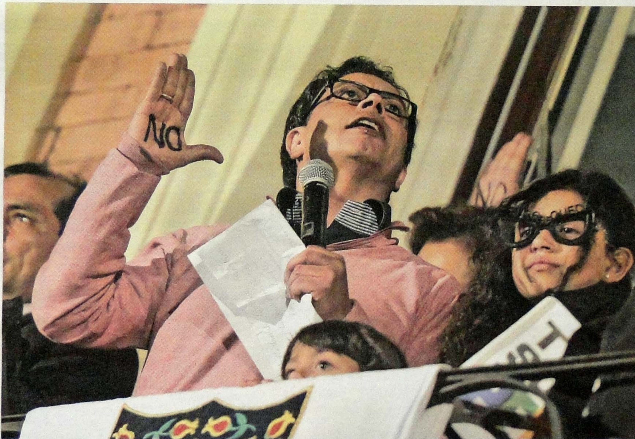
Gustavo Petro estuvo 35 días fuera de la Alcaldía de Bogotá. Hoy habrá concentración en la Plaza de Bolívar.

Tribunal Superior de Bogotá ordenó al presidente restituirlo en el cargo